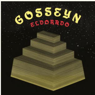
GOSSEYN - ELDORADO